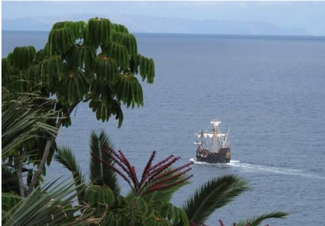
En replika av Columbus flaggskepp "Santa Maria". Nu tros det äkta skeppet ha hittats utanför Haiti.